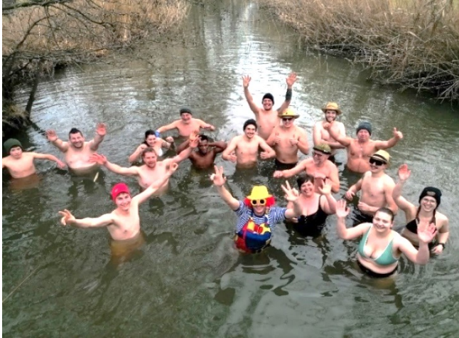
In Oberkemmathen wurde am Samstag, den 01.03.2025 offiziell die Badesaison 2025 eröffnet. Beim diesjährigen „Sulzach-Strand-Opening“ wurde wieder ein „Rekorderlös“ erzielt.