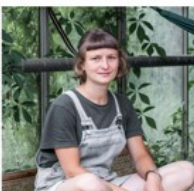
„Klimagerecht leben“ Ausstellung vom 23.5. bis 6.6.2025 im Rathaus Ornbau