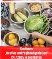
Kochkurs „Restlos und regional genießen“ 24.7.2025 in Bechtlofen